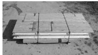
Benötigtes Werkzeug Hammer

*Flachrundschaube DIN 603 mit Scheibe und Flügelmutter