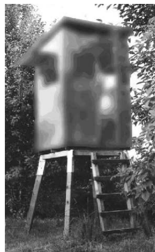
Abb. links zeigt die Montage am Beispiel der Kanzel Typ B.

Ringschraube mit Sechskantschraube M 8 x 50 an entsprechendem Rahmenteil verschrauben. Die eingehängte Leiter kann zusätzlich mit einem Schloß gegen Diebstahl, oder Herausfallen gesichert werden.